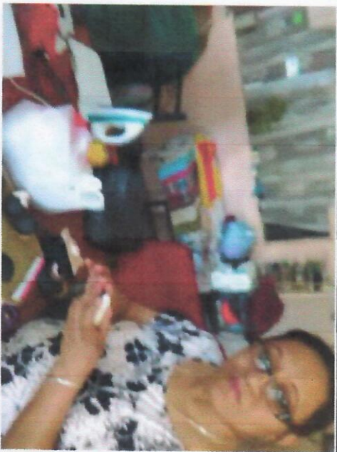
Taller de manualidades Col. Haciendas del Topo